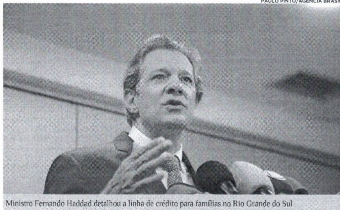
Ministro Fernando Haddad detalhou a linha de crédito para famílias no Rio Grande do Sul

"Já saiu a primeira medida, que foi o decreto de calamidade, que abre para os ministérios a possibilidade de aportar recursos emergenciais [a] escolas, hospitais, postos de saúde. Não tem como esperar. Então, isso tudo vai precisar de uma dinâmica própria. Mas nós estamos trabalhando em outras frentes importantes e