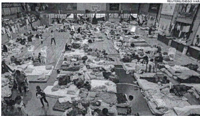
Valor para ajudar ao Rio Grande do Sul será liberado em parcerias com o BNDES, Banco do Brasil e o Banco Regional de Desenvolvimento do Extremo Sul

"O Banco do Brics tem um compromisso e vai atuar na reconstrução e na recuperação da infraestrutura do estado. Queremos ajudar as pessoas a reconstruir suas vidas. Vamos destinar, da maneira mais rápida possível, recursos para o estado. Será US$ 1,115 bilhão. Isso significa R$ 5,750 bilhões", escreveu Dilma Rousseff. Segundo Dilma, o montante será liberado em parcerias com o Banco Nacional de Desenvolvimento Econômico e Social (BNDES), o Banco do Brasil e o Banco Regional de Desenvolvimento do Extremo Sul (BRDE). "Em parceria com o BNDES, vamos liberar US$ 500 milhões, sendo US$ 250 milhões previstos para pequenas e médias empresas, US$ 250 milhões para obras de proteção ambiental, infraestrutura, água, tratamento de esgoto e prevenção de desastres. Em parceria com o Banco do Brasil, o NDB vai destinar US$ 100 milhões para infraestrutura agrícola, projetos de armazenagem e infraestrutura logística. Em parceria com o BRDE, vamos destinar US$ 20 milhões para projetos de desenvolvimento e mobilidade urbana e recursos hídricos". No curto prazo, serão destinados ainda, de acordo com Dilma, US$ 295 milhões previstos em um segundo contrato com o BRDE, em processo de aprovação final. "Destinaremos os recursos para obras de