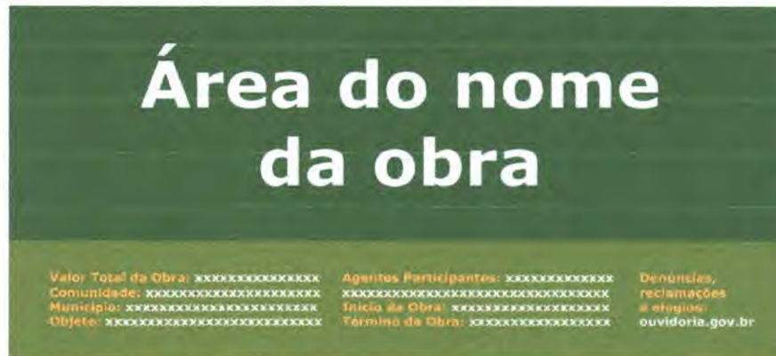
Figura 1 – Modelo da Placa de obra