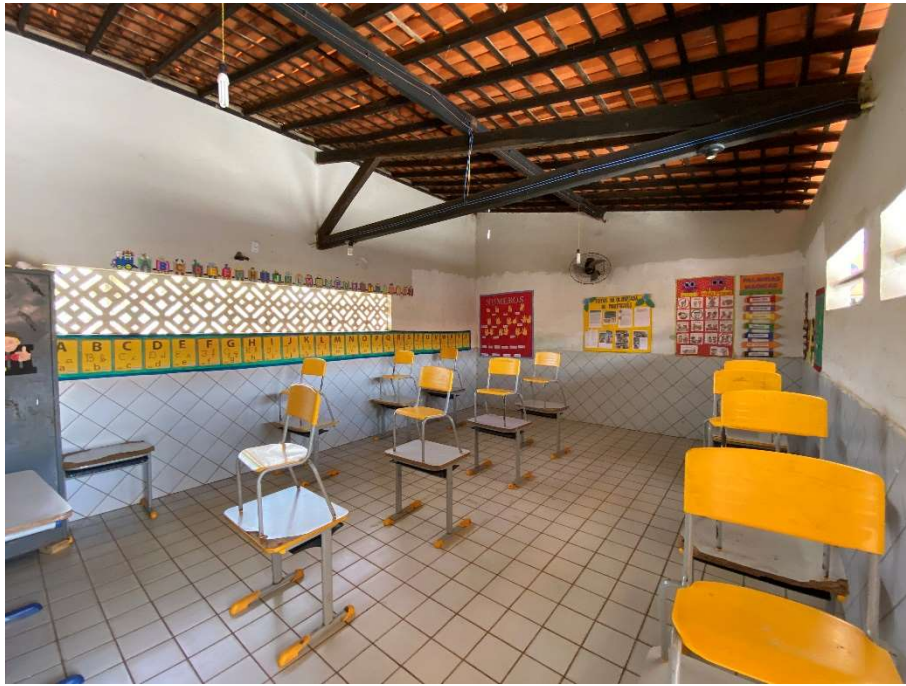
Salas com mobiliário danificado;