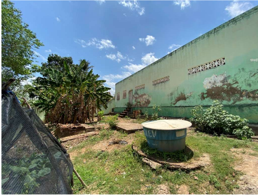
Revestimentos danificados nos fundos da unidade;