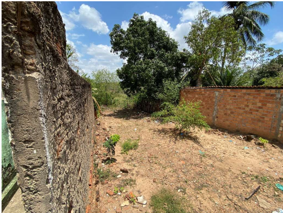
Terreno disponível para construção;