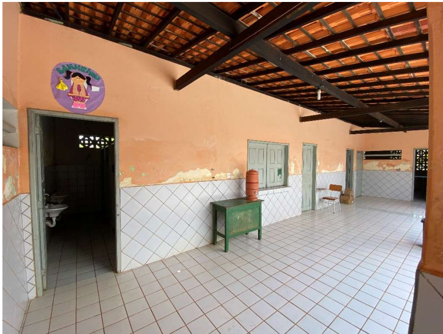
Revestimento de parede danificado (Cantina);