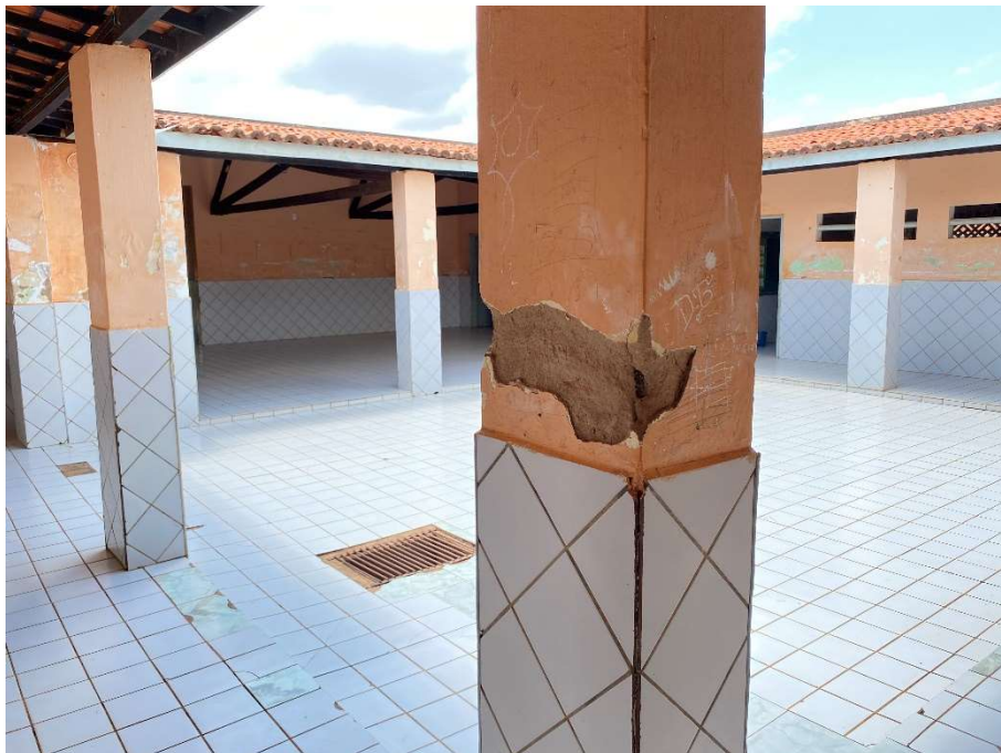
Revestimento das colunas arrancado/quebrado;