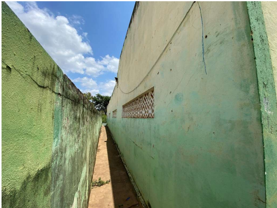
Revestimento de parede necessitando reparos;