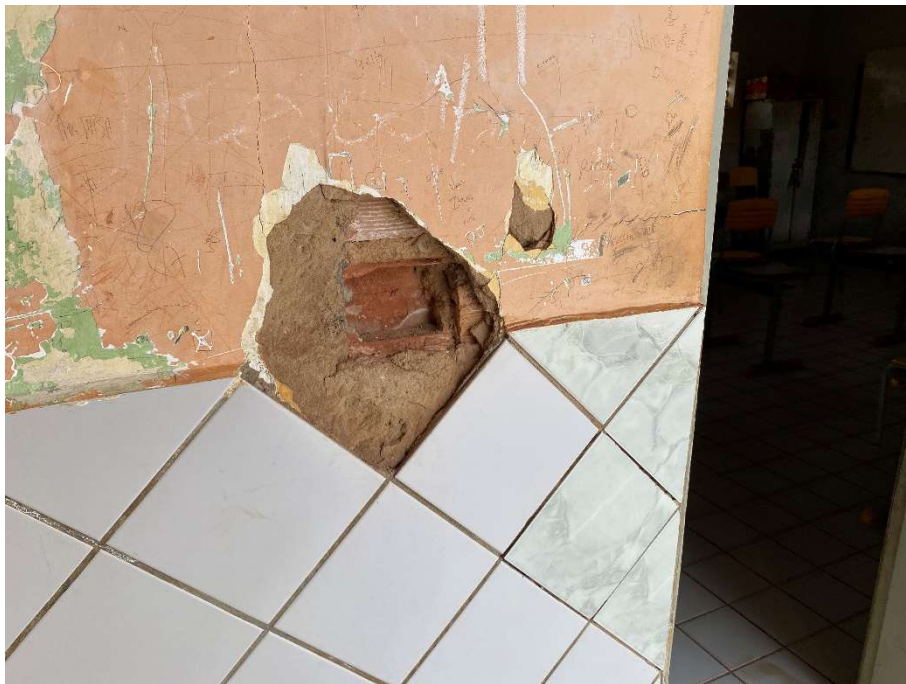
Revestimento cerâmico arrancado/quebrado;