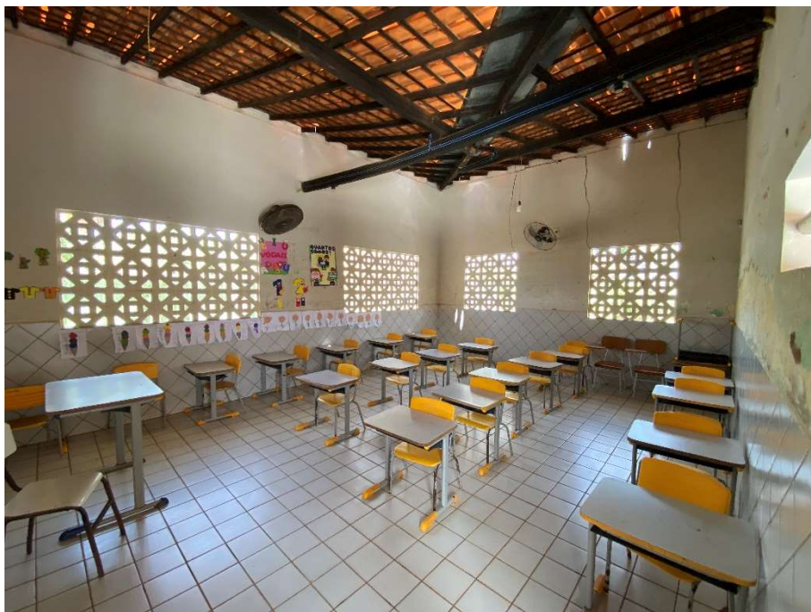
Presença de cupim e goteiras nas salas;