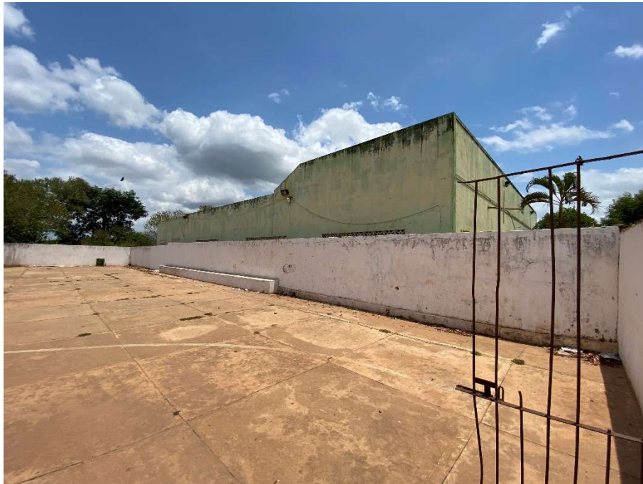
Quadra esportiva com piso inadequado;