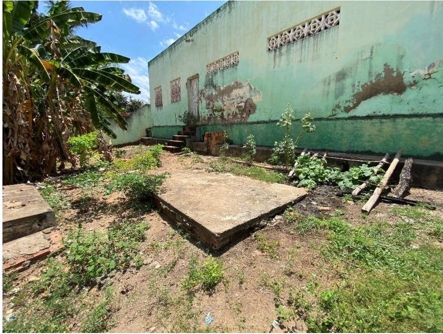
Área destinada à fossa séptica;