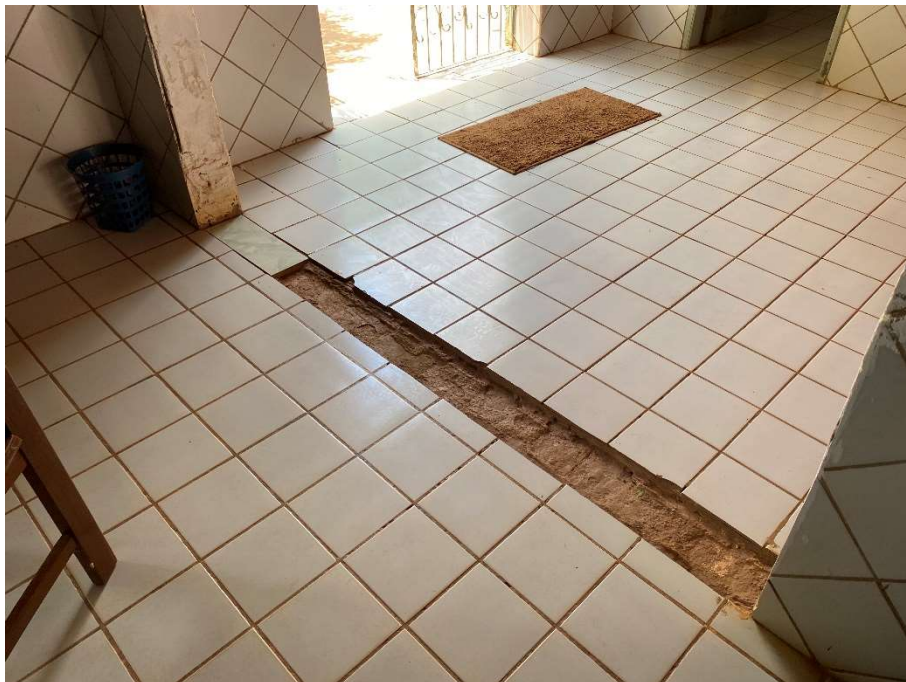
Revestimento cerâmico arrancado/danificado;