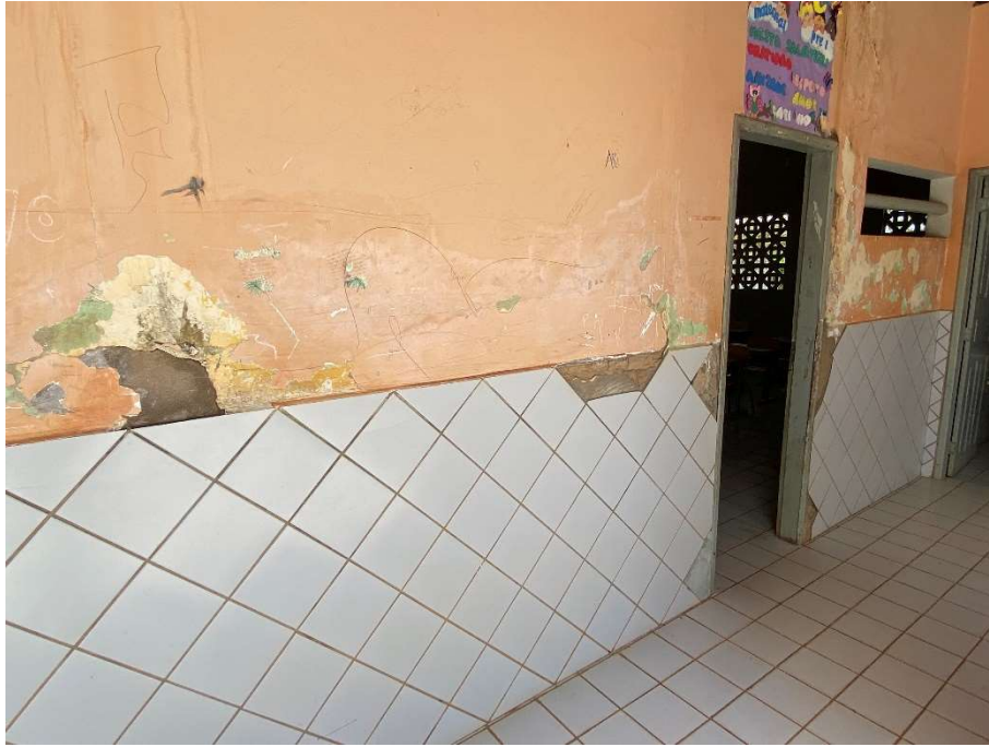
Revestimento de parede danificado;