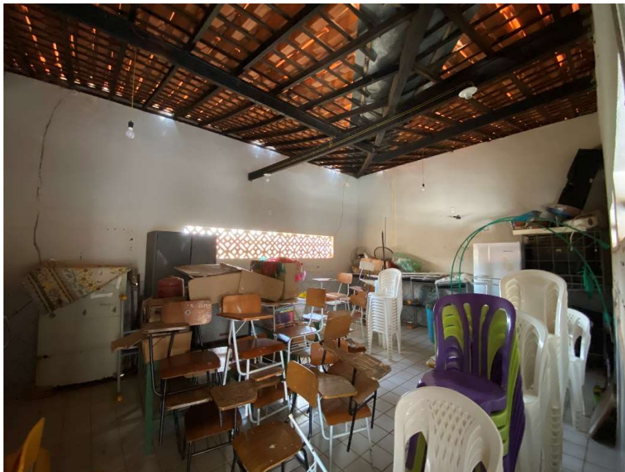
Sala utilizada como depósito;