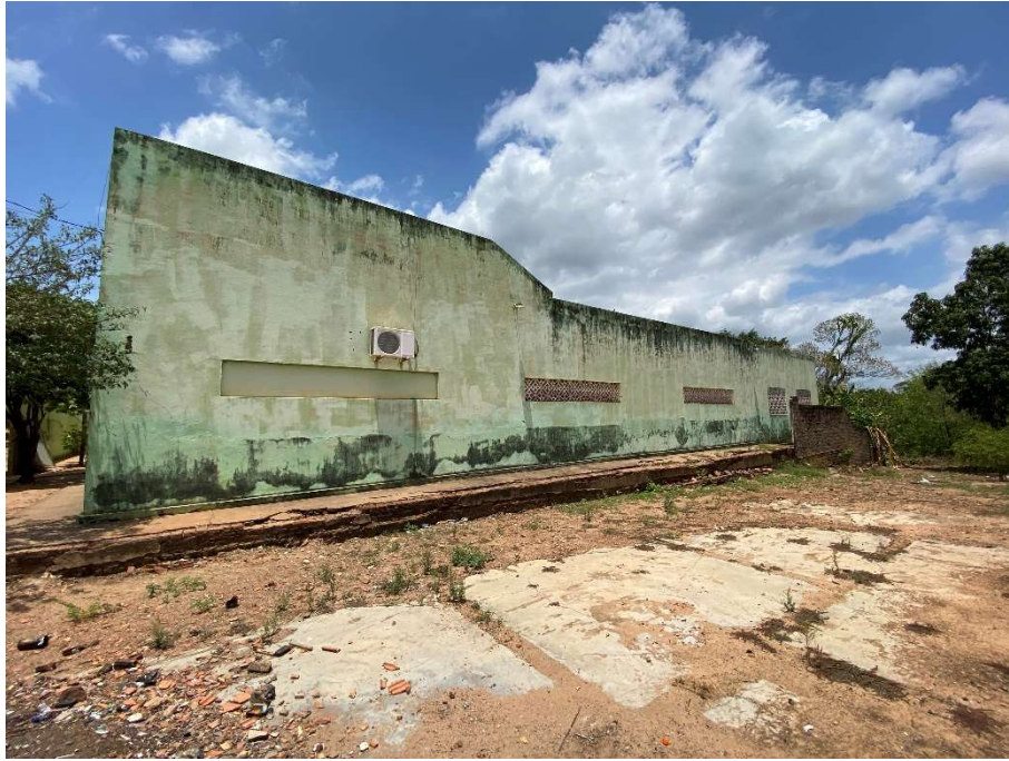
Revestimento de parede danificado nas laterais da unidade;