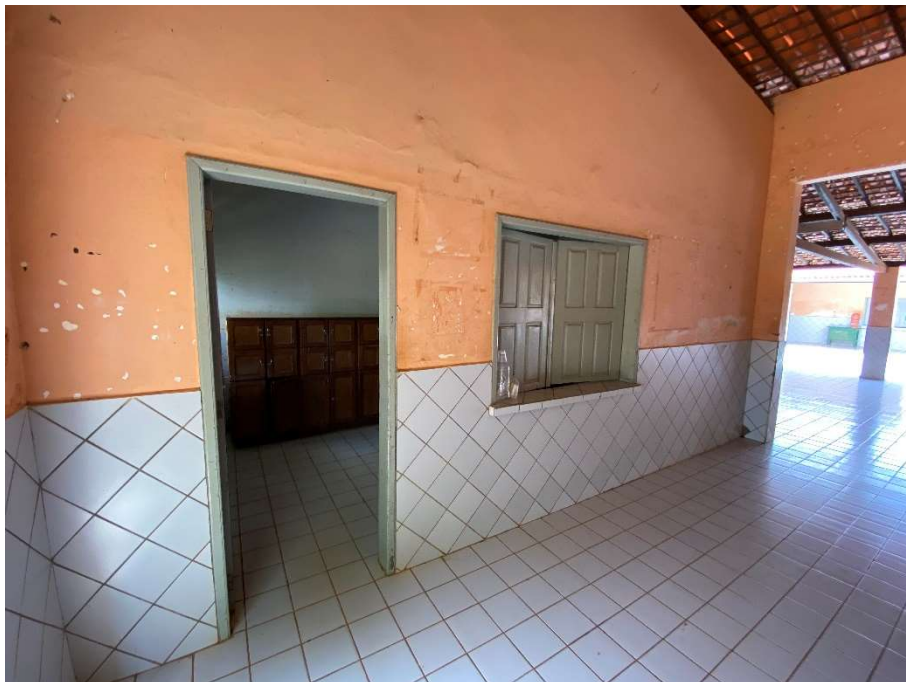
Portas e janelas antigos e danificados;