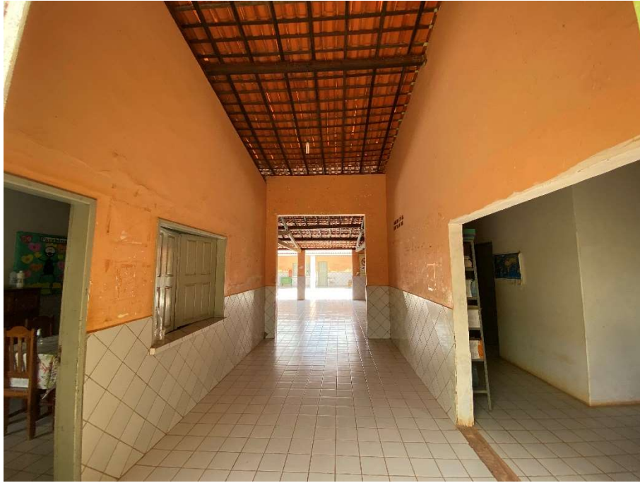
Área de circulação interna;