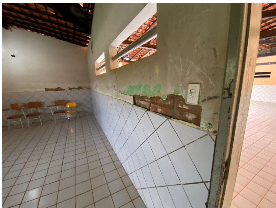
Revestimento de parede danificado;