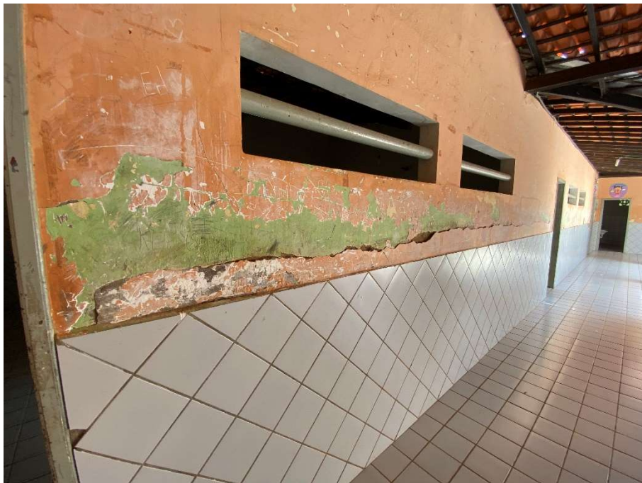
Revestimento de parede arrancado/danificado;