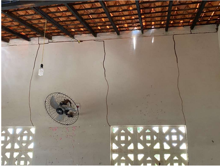
Presença de cupins nas salas;