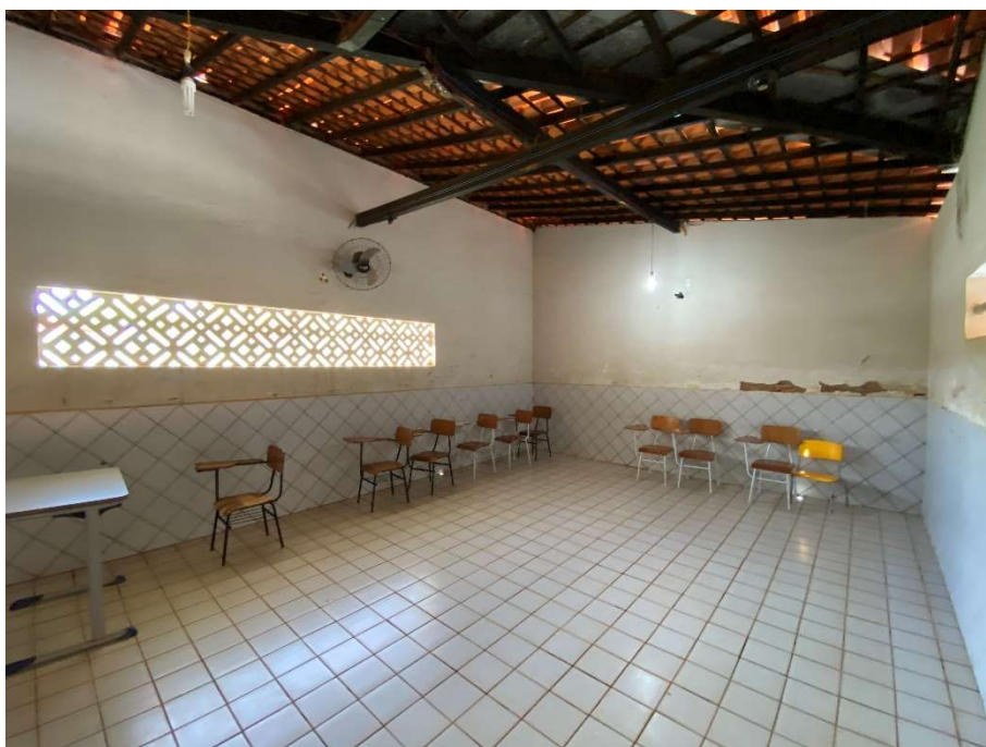
Revestimento de parede danificado;