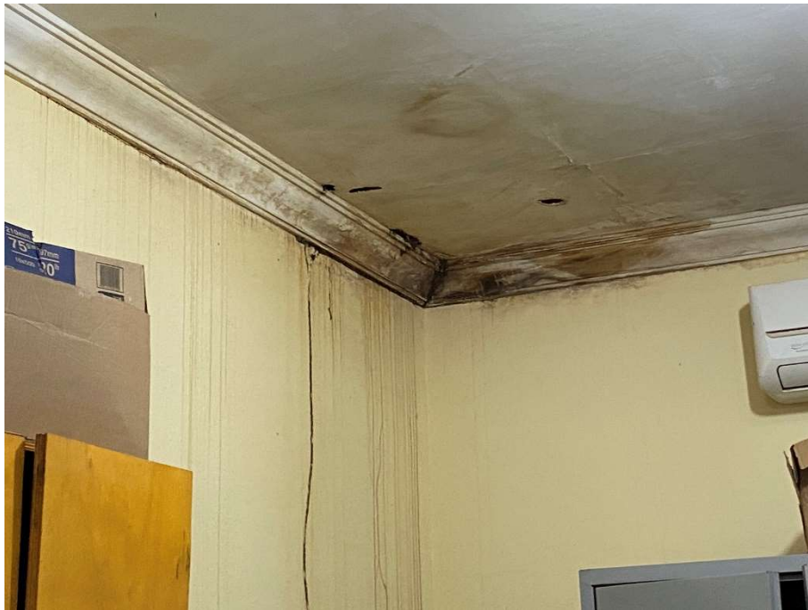
Presença de morfo e bolor na diretoria;