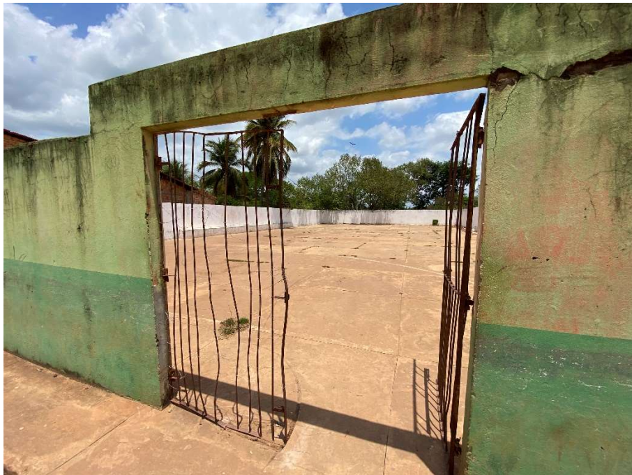
Ausência de portão de entrada na quadra esportiva;