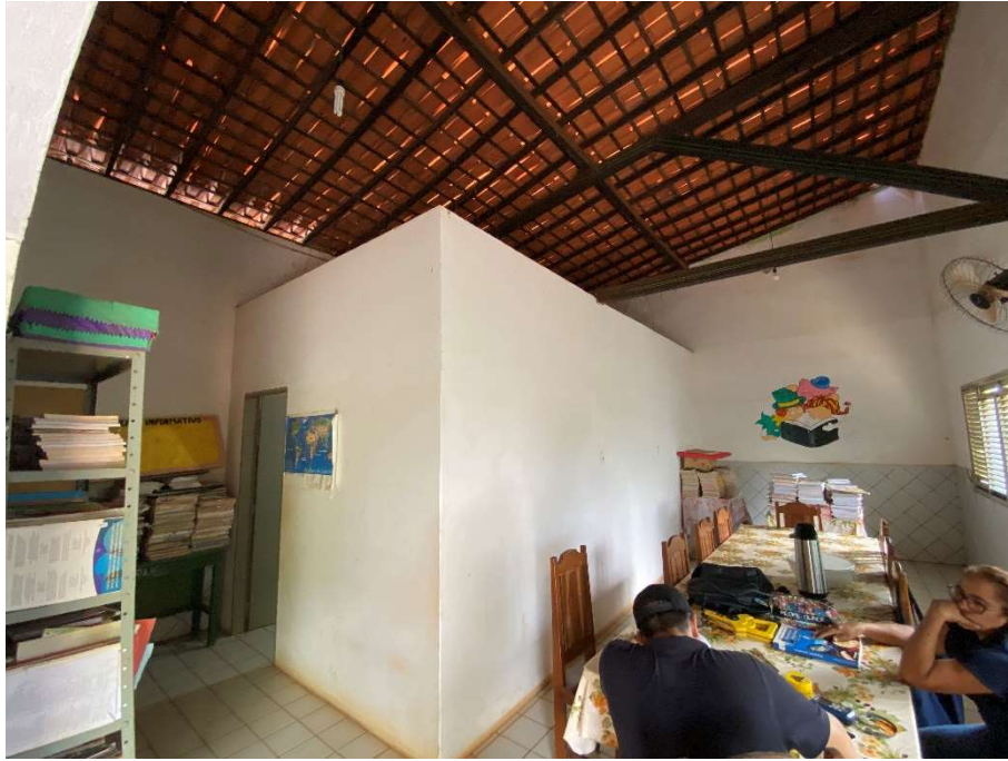
Sala dos professores com ausência de ventilação;