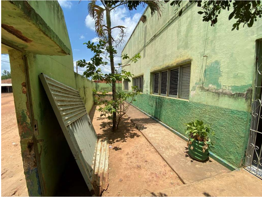
Ausência de portão de entrada;