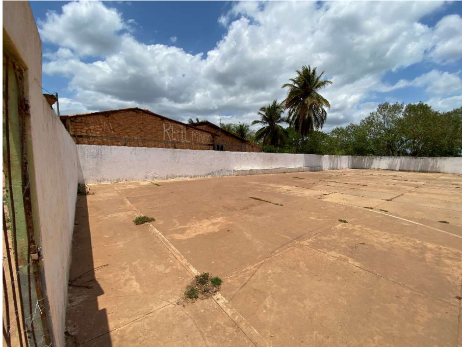
Quadra esportiva com piso inadequado;