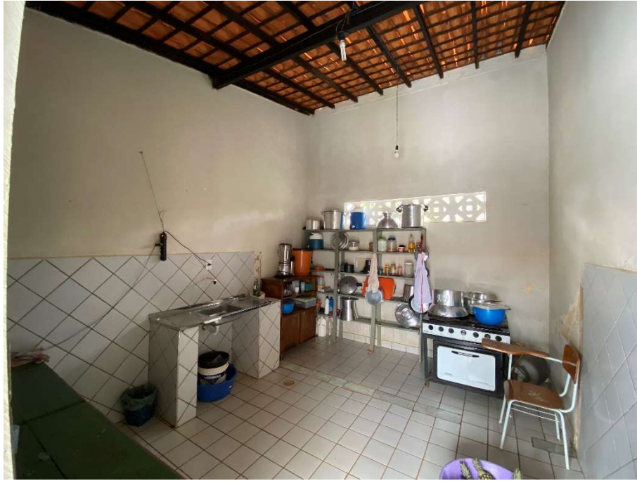
Cozinha com ausência de mobiliário;