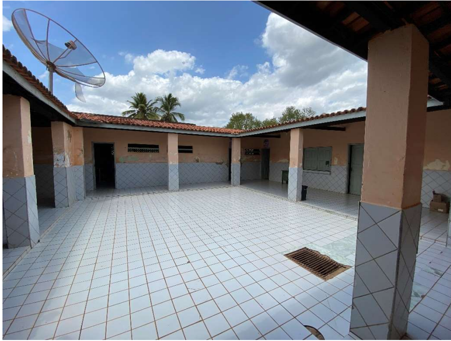
Pátio aberto (área central da unidade);