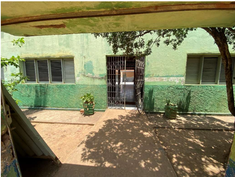
Portão de entrada empenado/quebrado;