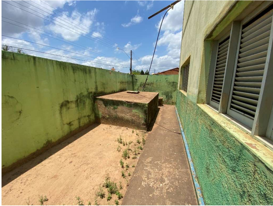
Área destinada à cisterna;