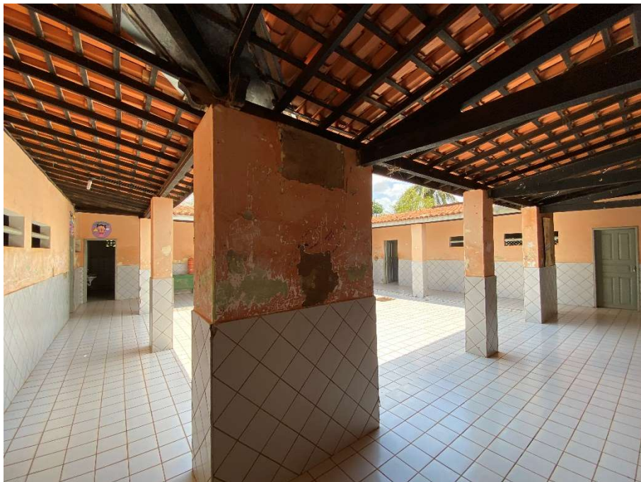
Revestimento das colunas danificado;