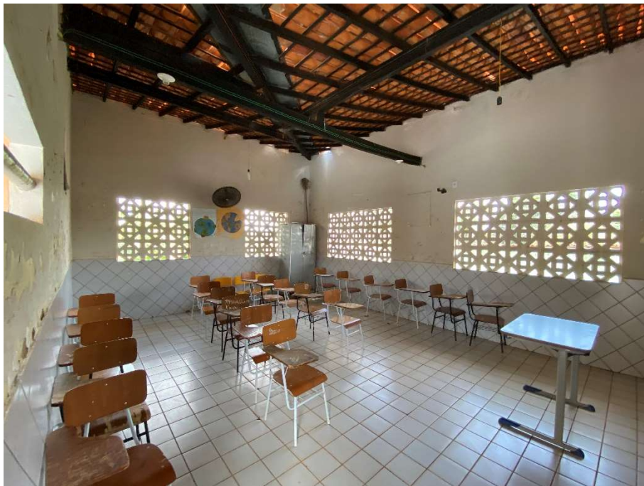
Ausência de iluminação e ventilação adequada;