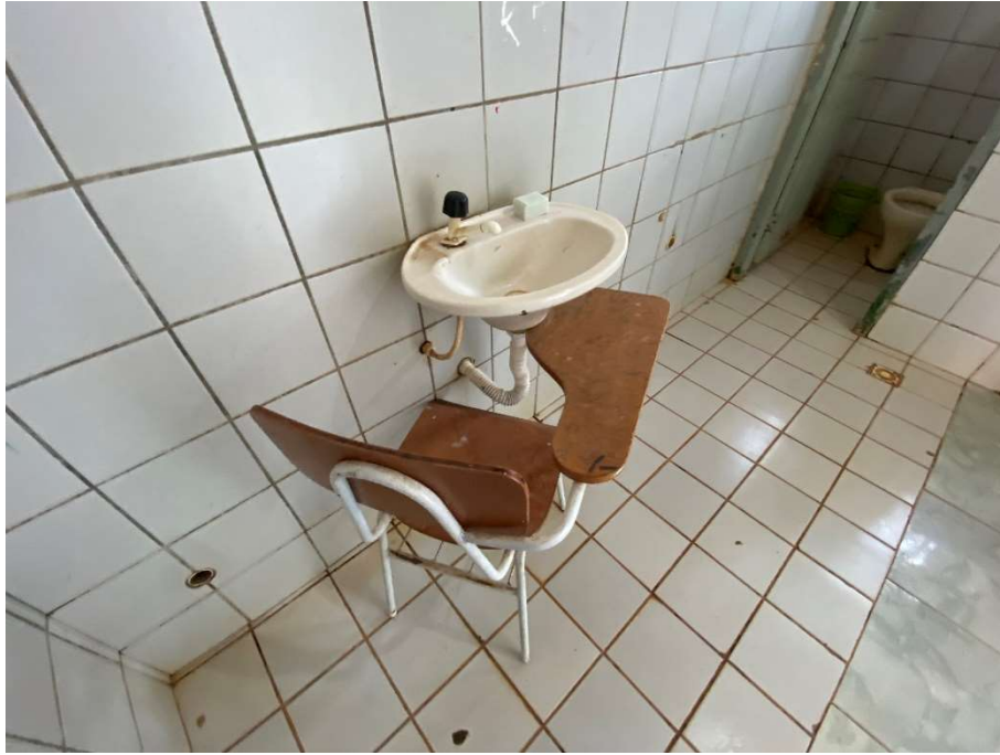
Instalação hidráulica quebrada/danificada;