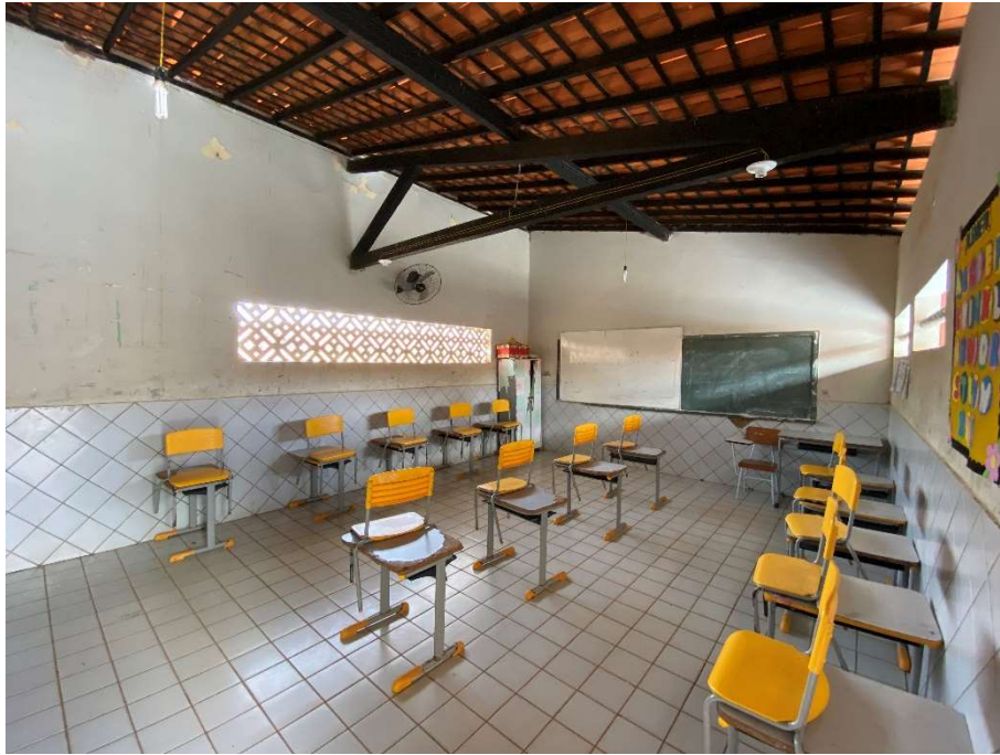
Ausência de iluminação e ventilação adequada;