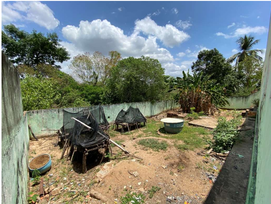
Área sem calçada e piso adequado;