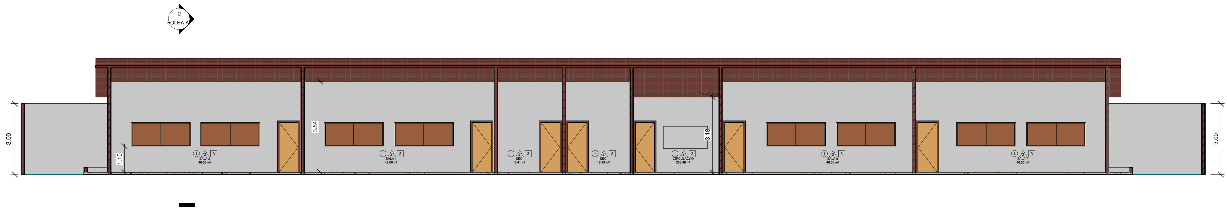
1 Corte 2 1 : 75