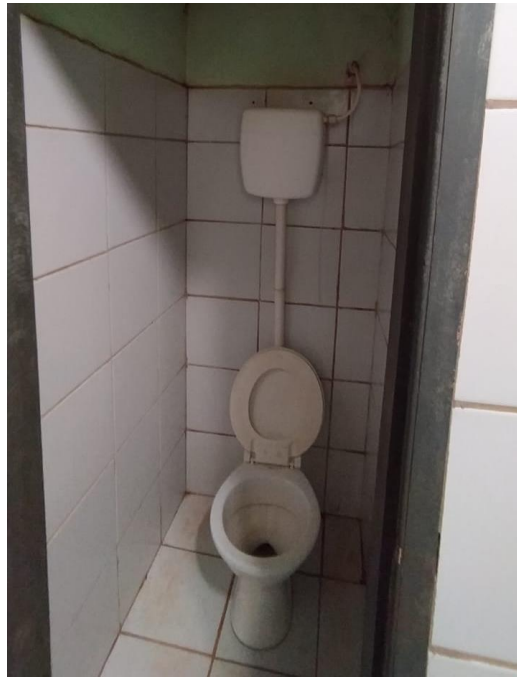
Sanitários com antigas instalações e mal funcionamento;