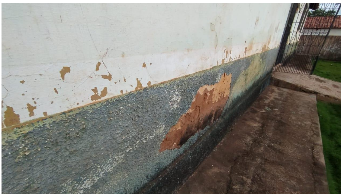
Parede com descamação de revestimento;