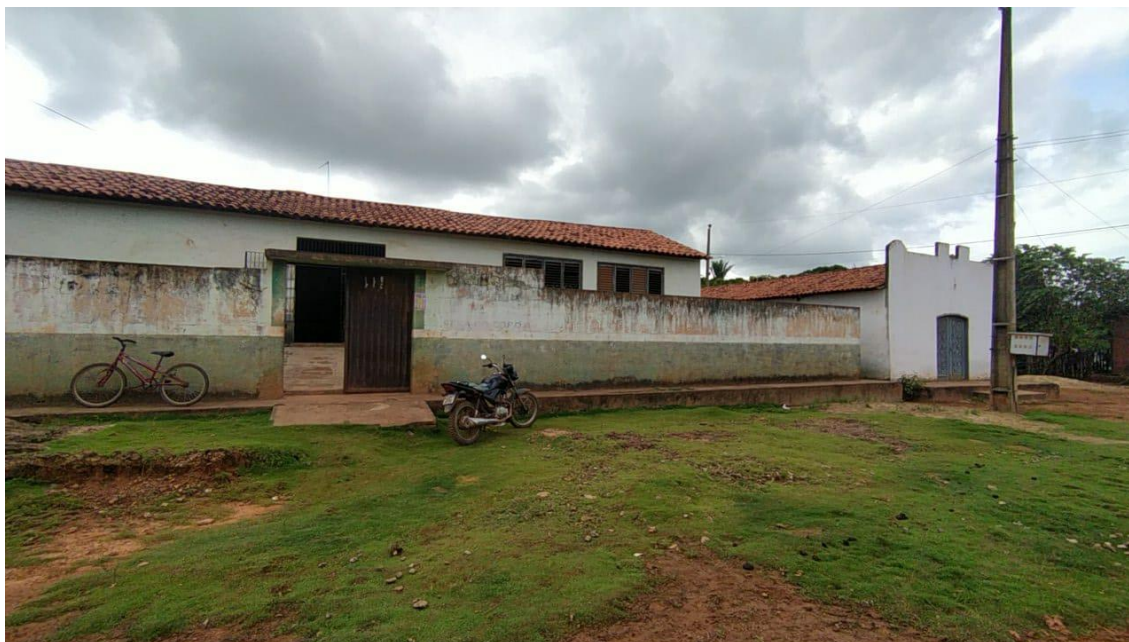
Revestimento de fachada frontal com descamação de revestimento;