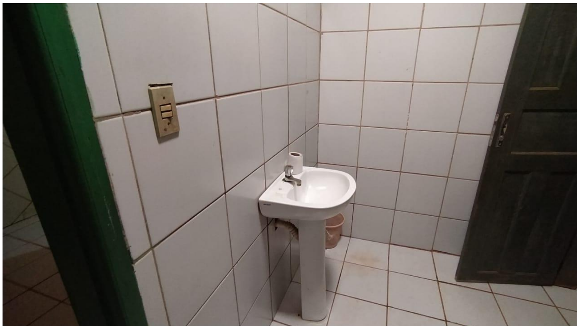
Lavatórios com mal funcionamento e em pouca quantidade;