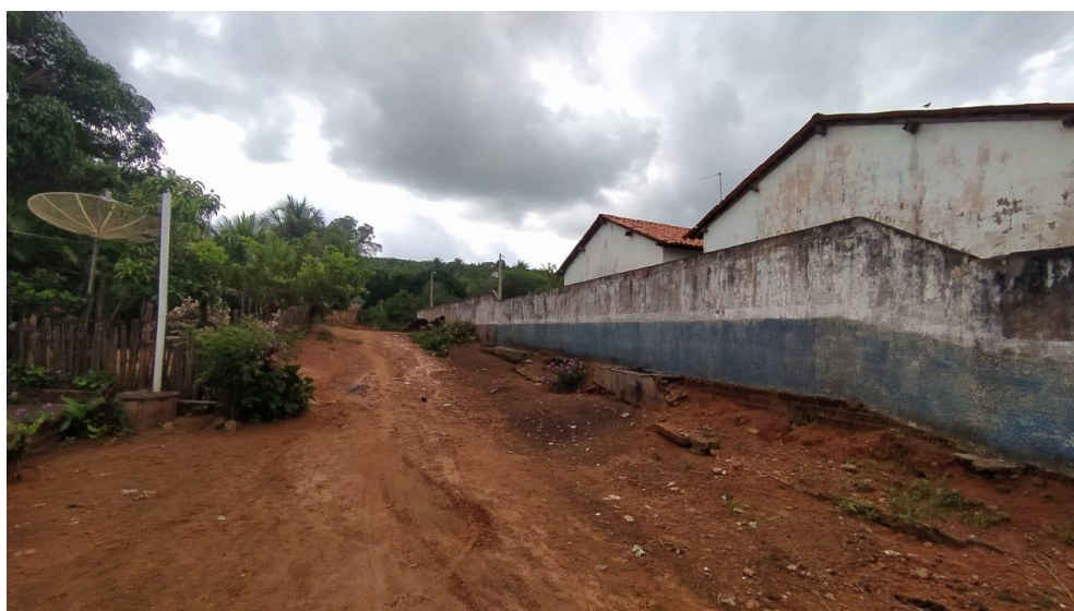
Revestimento de fachada lateral com descamação de revestimento;