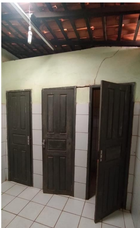
Paredes com rachaduras e portas sem trincos;