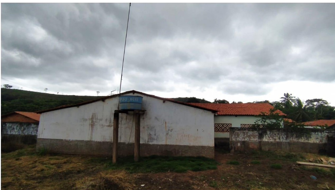
Estrutura da caixa d'água com fissuras e infiltrações;