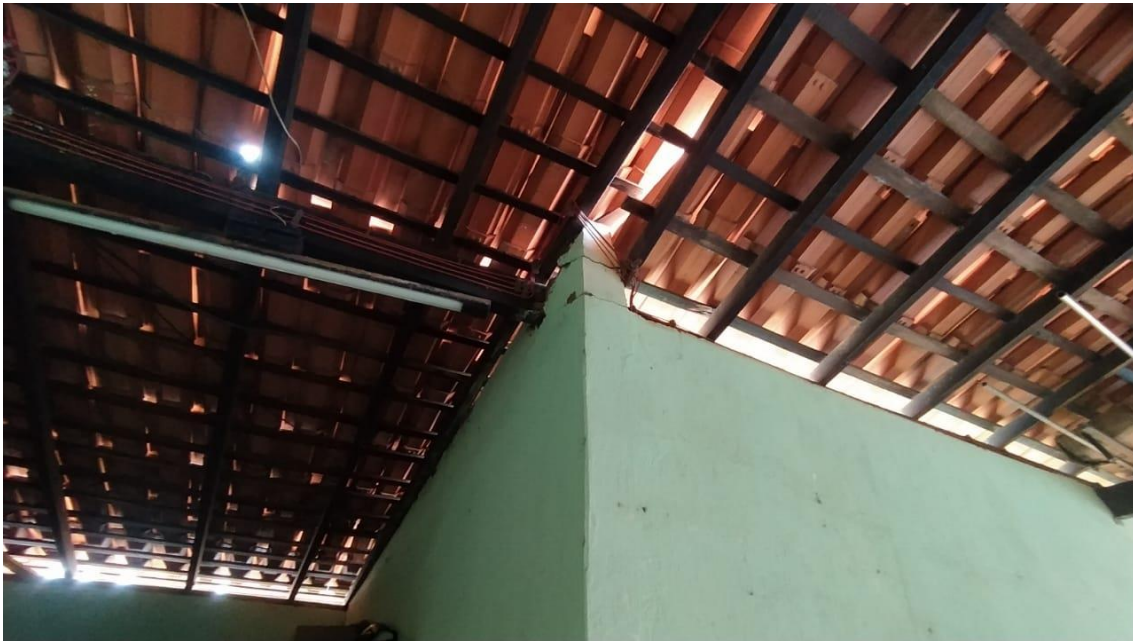
Goteiras presentes em todo ambiente escolar;