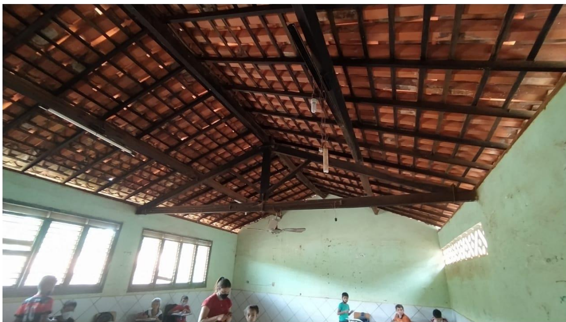
Janelas quebradas, instalação elétrica exposta;