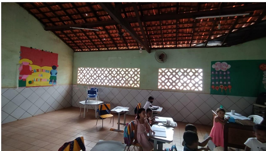
Salas com infiltrações e piso cerâmico amarelado;