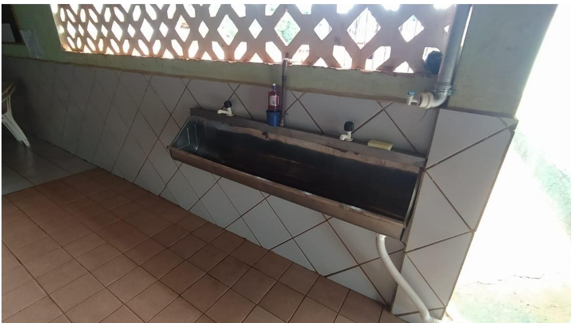
Bebedouro junto com lavatório;