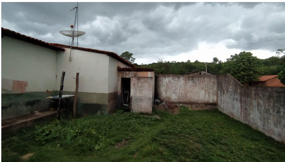
Área de serviço sem estrutura e depósito com descamação de revestimento e sem porta;