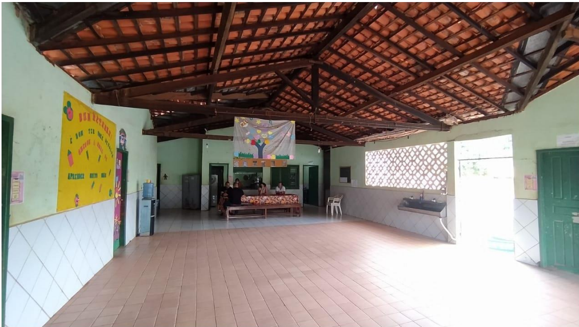
Refeitório com dois tipos de piso e paredes com fissuras;