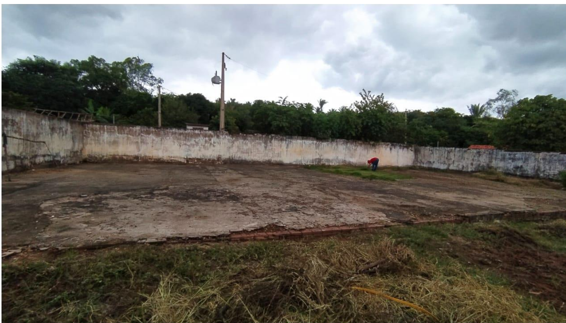
Quadra sem cobertura e sem piso propício para o esporte;