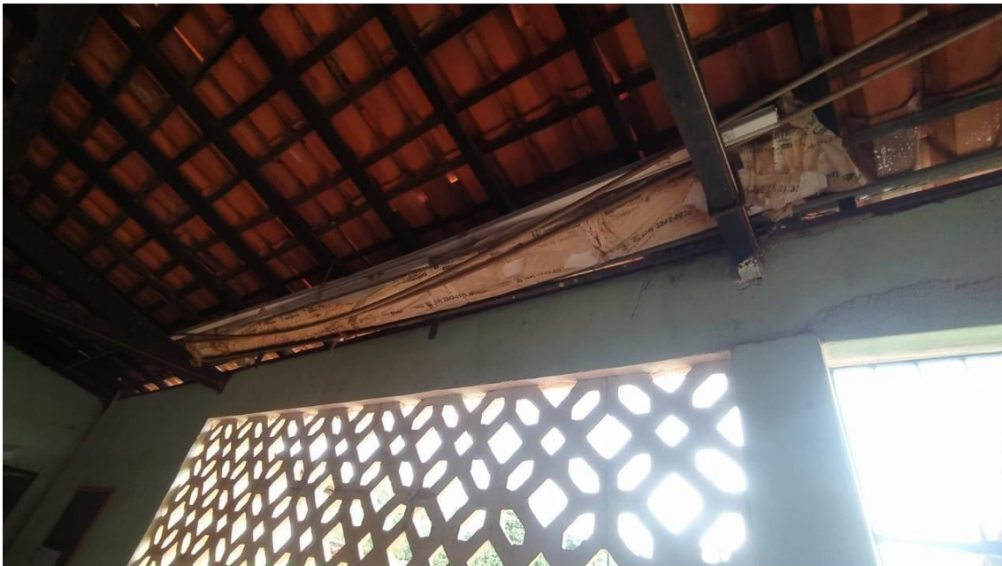
Tubulação de água fria exposta na cobertura;