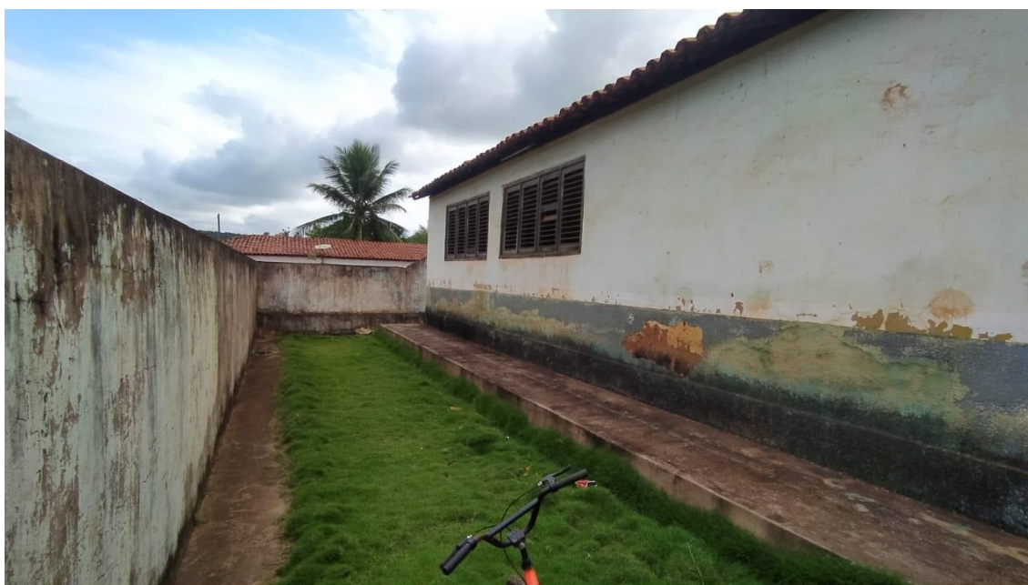
Parede lateral com descamação de revestimento;